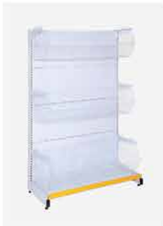
Inicial parede com Cestos