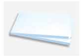
Bandeja para Base