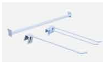
Régua p/ Ganchos Gancho Simple/Duplo