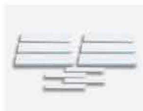
Bandeja para Rack com SLG