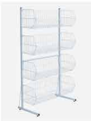
Cesto Empilhável Grande Alt.: 1600mm - Comp.: 940mm