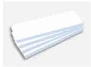
Bandeja com um Reforço