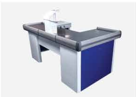
Check-out 2m Vermelho Check-out 2m Azul