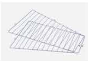
Divisórias para cesto