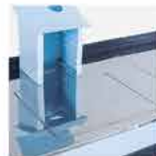
Recorte para balança