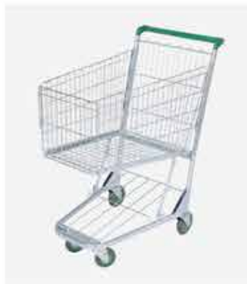
Carrinho de Supermercado Simple ou Duplo 90L / 130L