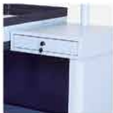
Gaveta para Documentos