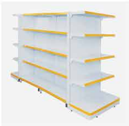
Ponta Podium + Continuação Centro + Continuação Centro + Ponta Podium

A linha Super Plus é a solução adequada para armazenagem e exposição de cargas intermediárias. Com espaçamento 25mm e SLG (Suporte Lateral de Gôndola) com possibilidade de até 03 regulagens das prateleiras (reto, elevado, rebaixado), o pé é soldado em "T", facilitando a montagem e garantindo maior segurança e estabilidade. O painel é de encaixe e possui modulação de 1,00m de coluna a coluna. É produzida nas cores preta e branca. Outras cores sob consulta.