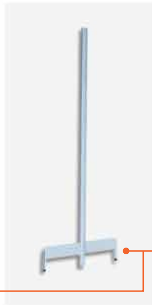
Coluna de Centro New Plus