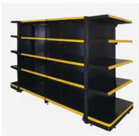
Ponta Podium + Continuação Centro + Continuação Centro + Ponta Podium

A linha de Gôndola Super Plus luxo é a solução perfeita para armazenagem e exposição de grandes e pesadas cargas. Com acabamento em grande estilo, a Linha Super Plus Luxo atende um público mais exigente, que precisa de praticidade, mas não abre mão do glamour de um produto mais robusto e que chama atenção. Passo 25mm, que otimiza o espaço entre as bandejas, e SLG (Suporte Lateral de Gôndola), com possibilidade de até 03 regulagens das prateleiras (reto, elevado, rebaixado), possui modulação de 1,20m de coluna a coluna, facilitando e garantindo maior segurança e estabilidade à gondola. Possui painel duplo de encaixe, que facilita a montagem, e um primoroso acabamento. Pode ser configurada com uma vasta gama de acessórios para atender as mais variadas necessidades de exposição do produto do cliente. Produzida nas cores preta e branca. Demais cores sob consulta.