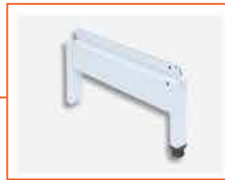
Pé para Gôndola de Centro