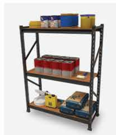
Material de Construção