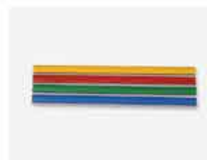
Porta Etiquetas azul, verde vermelho e amarelo