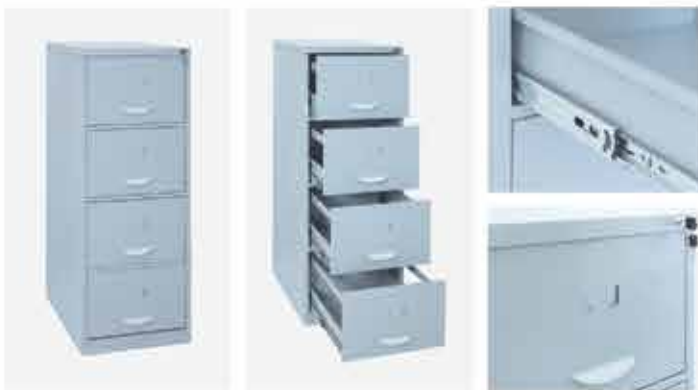
Arquivo de aço 04 gavetas