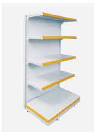
Ponta com Podium