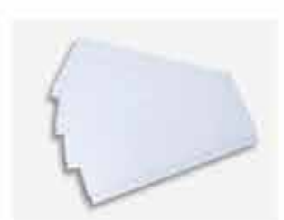
Fundo para Gôndola