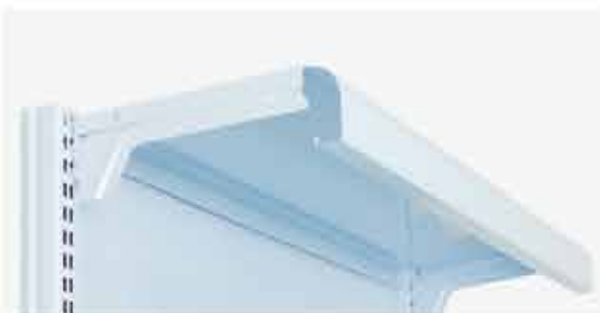
Testeira para Gôndola de Farmácia Também vendido separadamente