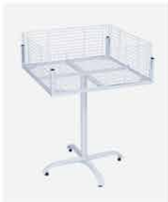
Banca de Ofertas 800 x 800mm Alt.: 1000mm - Alt. da Grade: 250mm

Diversos acessórios, complementos e aramados para aumentar a visibilidade dos seus produtos nas nossas gôndolas, racks e demais linhas. Facilita a organização do seu estabelecimento e melhora a exposição para o seu cliente.