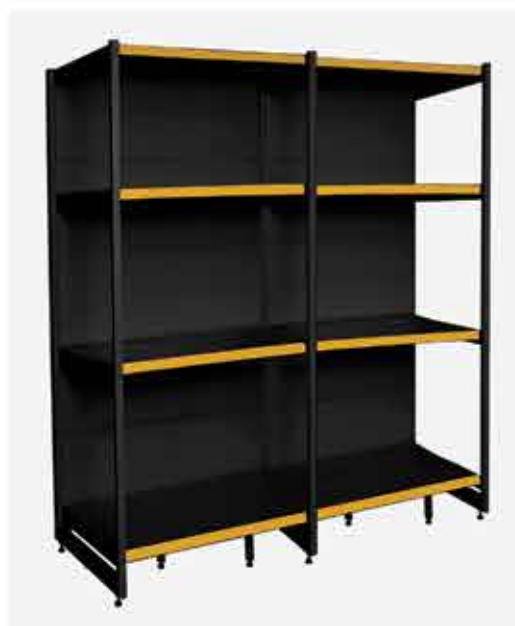
Rack Inicial + Continuação Preto