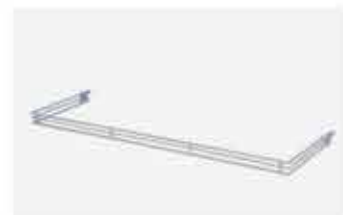
Aparador em U