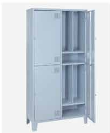
R04 PG Insalubre