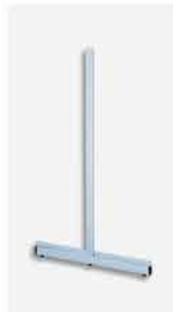
Coluna Super Plus