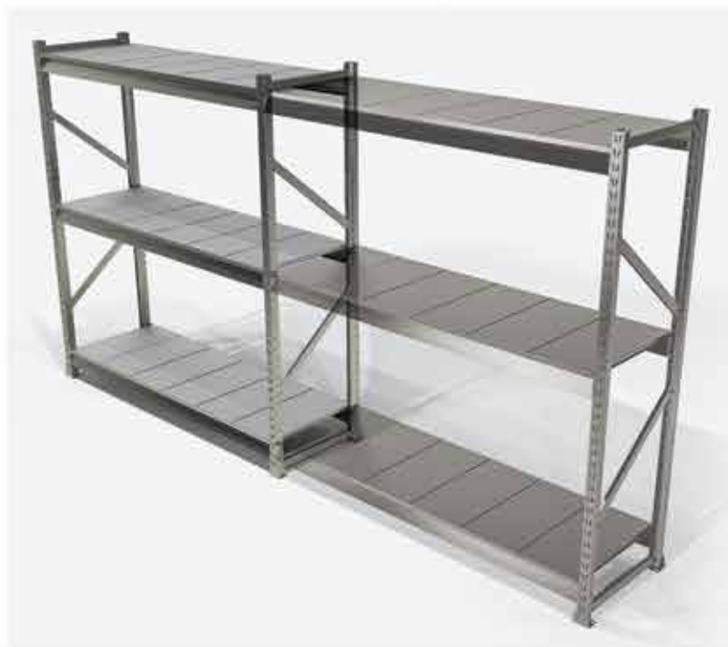
Mini Porta Pallets Slim Inicial + Continuação

Possibilidade de utilização de planos metálicos e madeira, com o Mini Porta Pallet SLIM você pode organizar seus documentos, sua despensa, escritório ou loja. Versátil, é utilizado desde residências à comércios. Verifique suas formas de aplicações, se você tem uma papelaria, um pet shop, oficinas, floricultura, hortifrúti, casa de construção ou até mesmo no uso doméstico, não pode deixar de conhecer esta excelente solução para organizar e armazenar seus produtos e materiais. Conheça! Solicite mais informações!