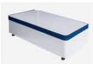
Podium Ponta de Gôndola New Plus