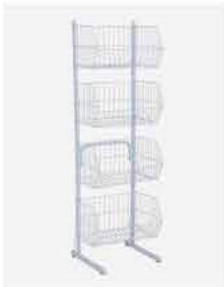
Cesto Empilhável Pequeno Alt.: 1600mm - Comp.: 480mm