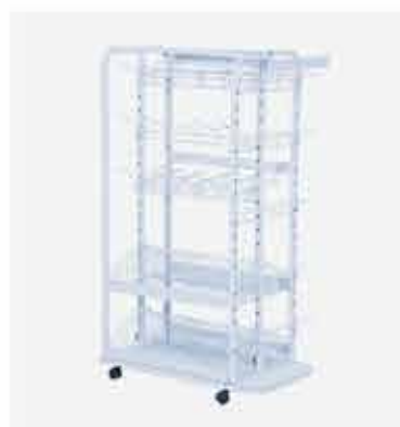
Check stand 71 x 41cm Alt.: 1,23m