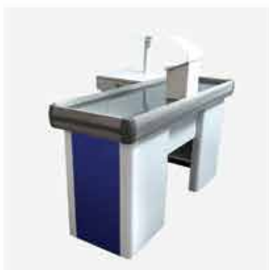
Check-out 1,5 m Vermelho Check-out 1,5 m Azul