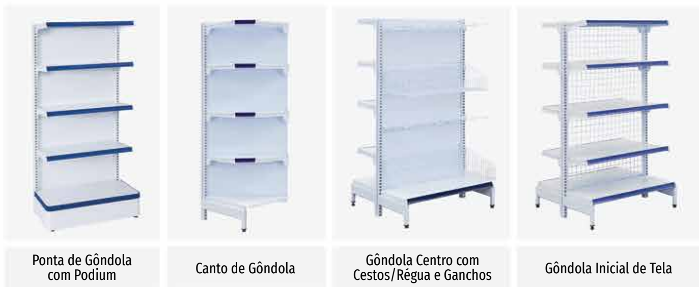
Ponta de Gôndola com Podium