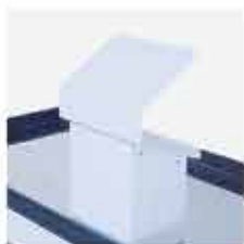
Suporte para Teclado