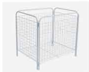
Cesto Multiuso 800 x 840mm Alt.: 640mm