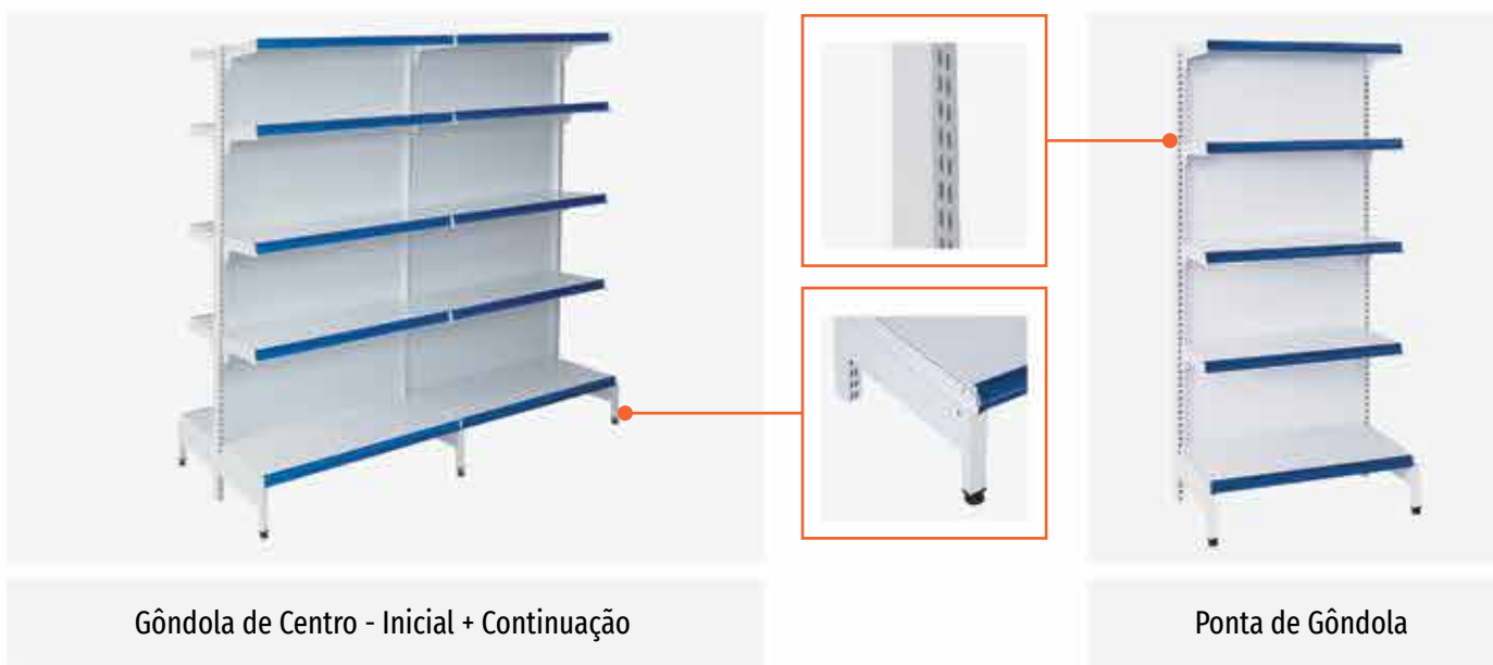
Gôndola de Centro - Inicial + Continuação

A linha New Plus é a solução ideal para armazenagem e exposição de pequenas cargas, com painel deslizante, coluna com espaçamento 25mm, garante maior segurança, estabilidade do produto e facilita a montagem. O SL (Suporte Lateral) possibilita até 03 regulagens das prateleiras (reto, elevado, rebaixado), permitindo mais opções de regulagem no posicionamento das prateleiras. Possui modulação de 0,95cm de coluna a coluna. Produzida nas cores branco e preto. Demais cores sob consulta.