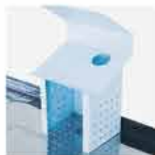
Suporte para Leitor de Código de Barras