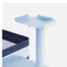
Suporte para monitor