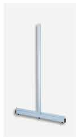
Coluna Super Plus Luxo