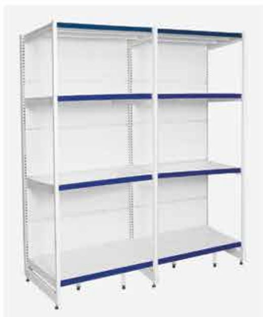
Rack Inicial + Continuação Branco

Nossa linha de racks armazena produtos pesados, com movimentação maior no espaçamento entre as colunas, você pode adequar melhor a necessidade dos produtos que deseja expor no seu comércio ou estoque. Exponha seus produtos pesados de forma organizada e bela, pode ser usado em vários departamentos, sejam eles bebidas, cereais, tintas, eletrônicos, rações... É uma solução completa para lhe atender e expor seu produto.