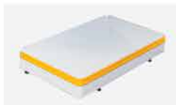
Podium Ponta de Gôndola Super Plus/Luxo