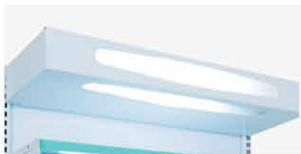
Testeira com iluminação para Gôndola de Farmácia Também vendido separadamente