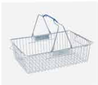
Cesta de Supermercado com Alça