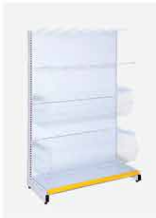
Inicial parede Cestos, Ganchos e Réguas