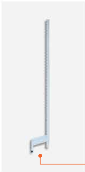
Coluna New Plus