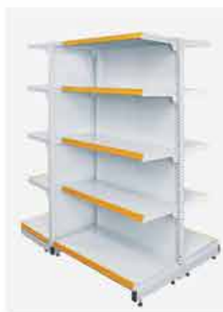
Continuação Centro + Ponta Podium